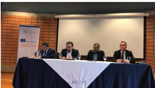
Tecnológico de Costa Rica.